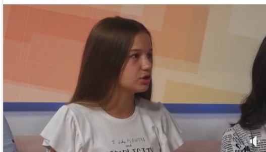
Prona - Montenegrin Science Promotion Foundation

Prilog Teinog gostovanja u jutarnjem programu TV NK, sa jednim od mentora koji je boravio sa njima. https://www.facebook.com/304136042967122/posts/4253167674730586/ ... Прикажи још